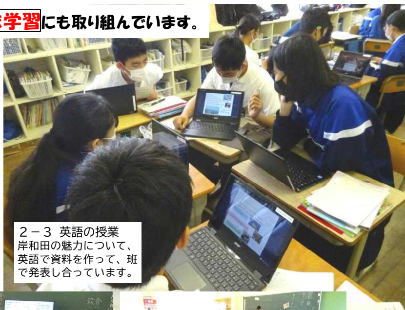
2-3 英語の授業 岸和田の魅力について、英語で資料を作って、班で発表し合っています。

また、先生たちも工夫して学び合って、どの学年でもタブレットを使った学習が、盛んにおこなわれています。