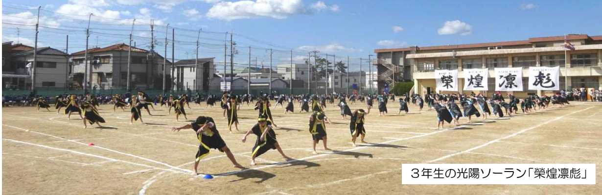
3年生の光陽ソーラン「榮煌凛彪」