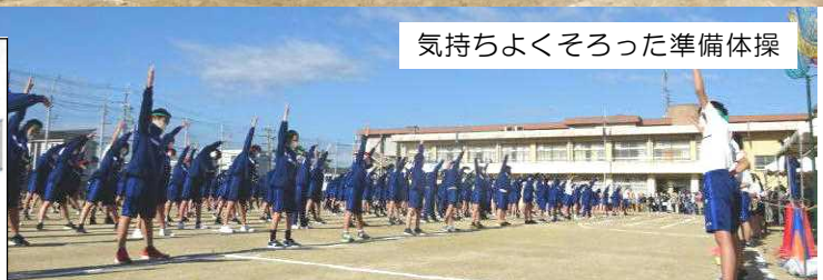
気持ちよくそろった準備体操